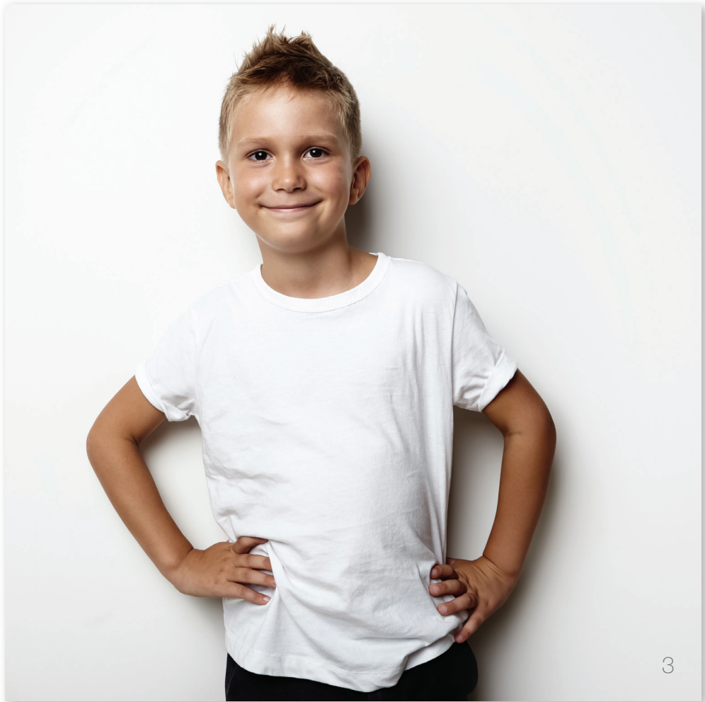
Einfarbiger, heller Hintergrund, Halbtotaler, Schatten für Kontrast