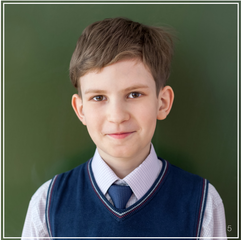
Schranktüre als Hintergrund, extra Rahmen