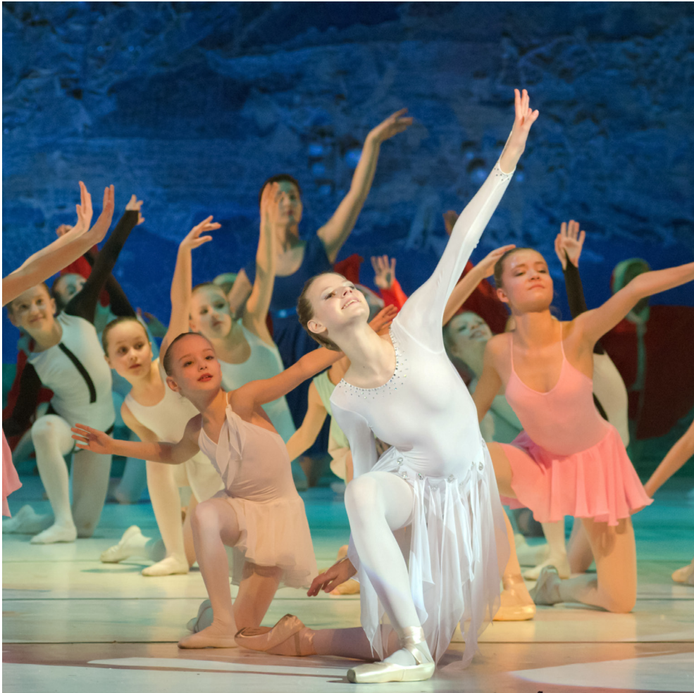
Musical und Tanz Vorführungen