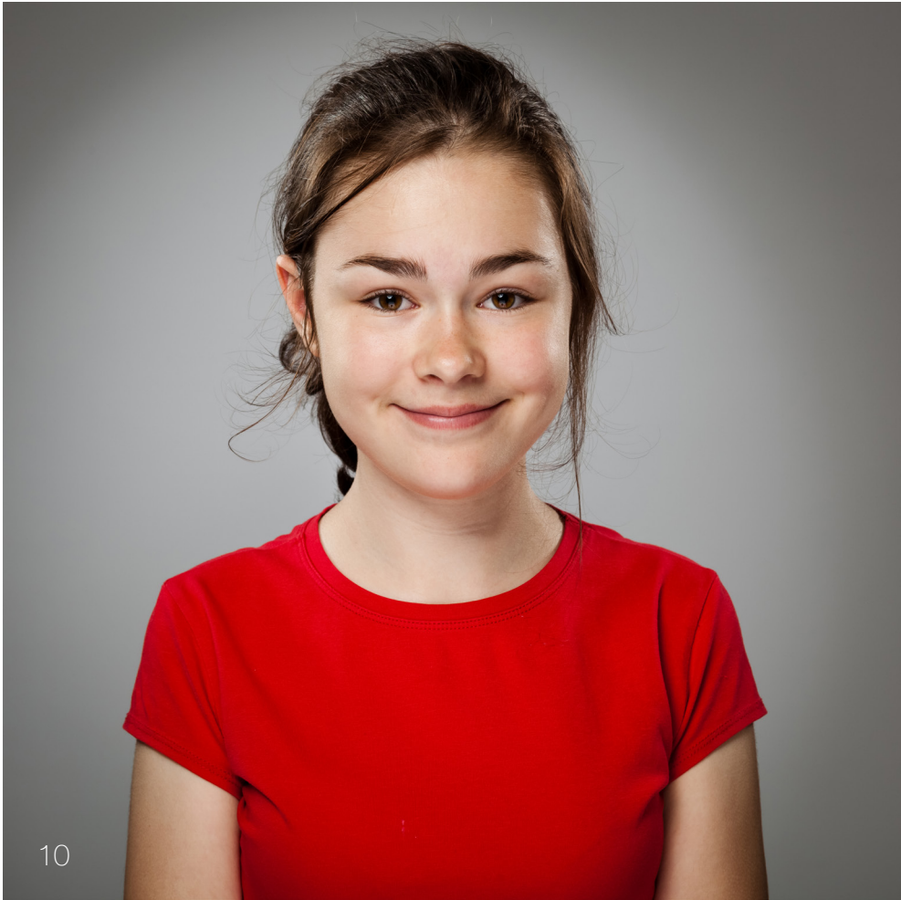
Porträt im Fotostudio Look