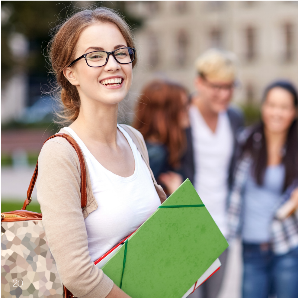
Schnappschuss vor der Schule