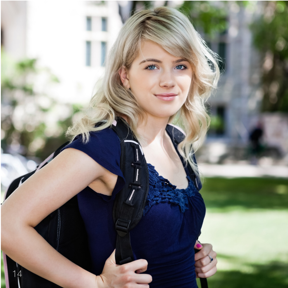
vor dem Schulhaus mit Rucksack